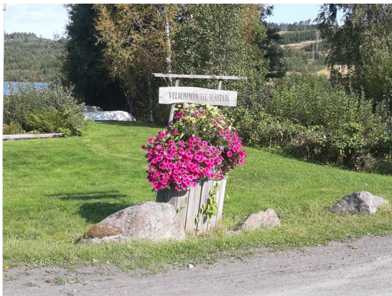
Her har de pyntet med blomster i veikrysset.