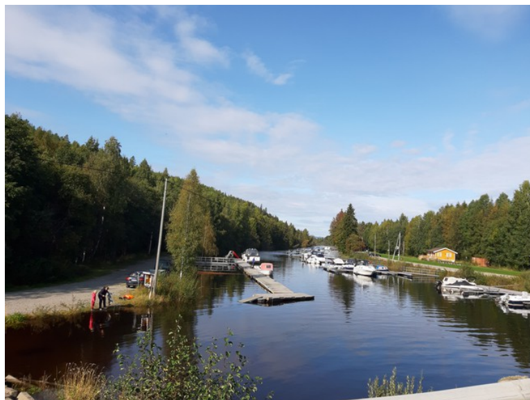
Så er vi kommet til brua over Vesleåa ved Storsjøen . Dette er utsikt nordover.

Den høyre bredden her er på en langstrakt øy som heter Engene . Den er nesten 5 km lang. Kvaliteten på høyet som blir slått her skal være spesielt god