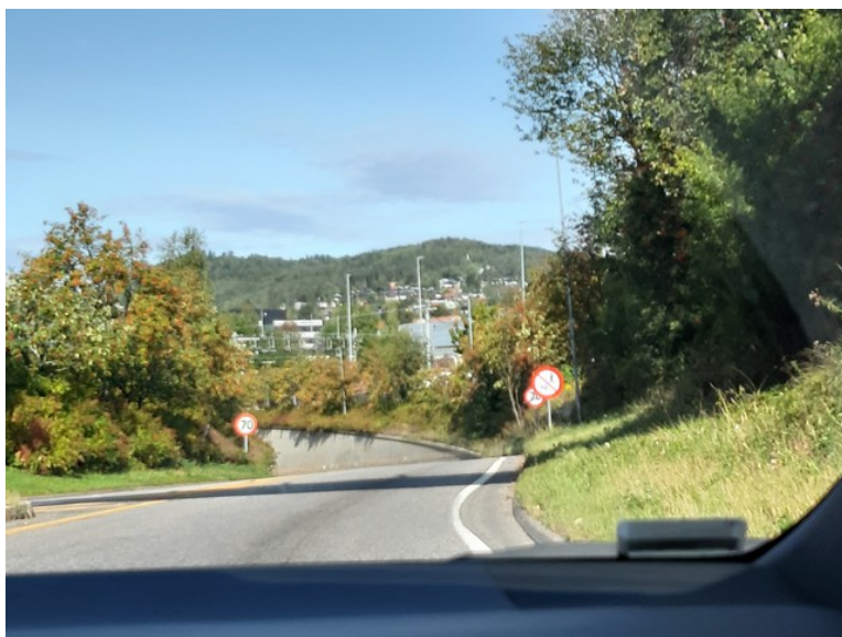
Her kommer vi til tunnelen under jernbanen ved Sundehjørnet.