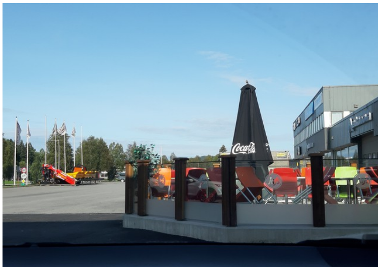
Vi startet med å fylle bensin på Uno-X på Rasta .

Denne dagen kjørte vi en tur til Storsjøen i Odalen. Vi kjørte motorveien til Sander og derfra via Slåstad og Kjølstad.