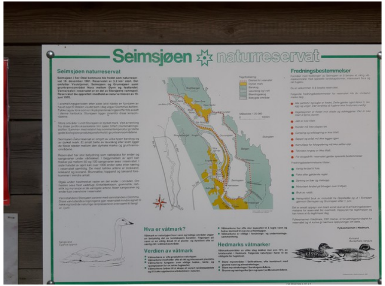
Ved enden av brua er det en poster som forteller om Seimsjøen naturreservat.

Storsjøen er forbundet med Glomma gjennom Oppstadåa . Normalt renner vannet fra Storsjøen til Glomma, men når det er flom i Glomma, snur strømmen og vann renner inn i Storsjøen. Dette påvirker på samme måte strømmen i Vesleåa som dermed går enten den ene eller andre veien. Storsjøen er en grunn sjø, 2-3 m dybde.