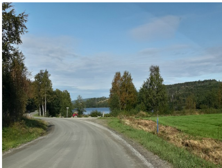
Her kommer vi til Nabben og får et glimt av Dølisjøen .