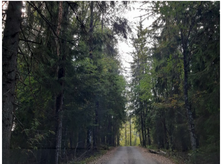
Her har vi kjørt over til Øyen gjennom et skogholt. Øyen er den største øya i Storsjøen.