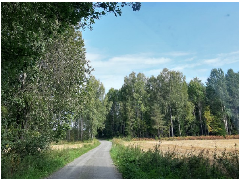
Det er også dyrkede områder. Det er to gårdsbruk her i dag som er bofaste.