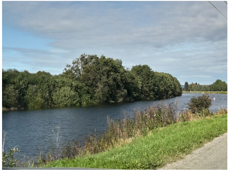
Deretter kjørte vi tilbake til Engen og helt til endes sydover hvor vi snudde. Vi har Vesleåa på den ene siden hele veien.