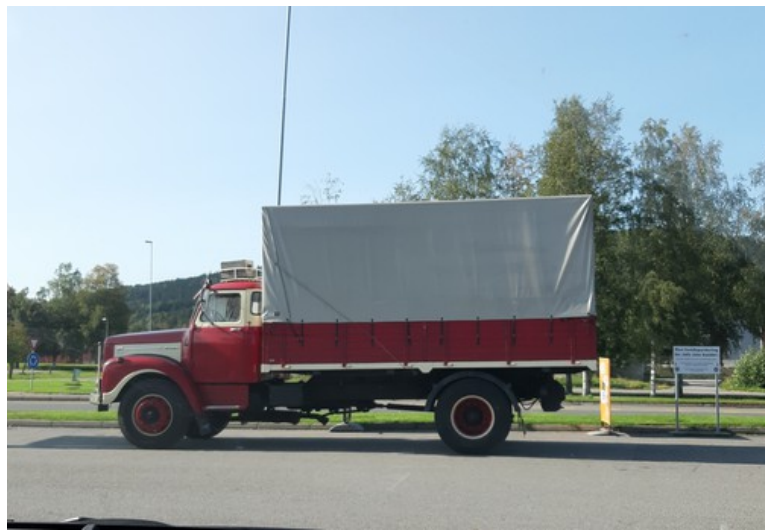
Her sto det en lastebil av gammel type.