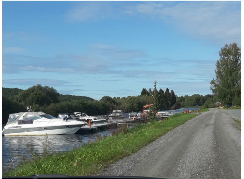
Så er vi tilbake til båthavnen. Derfra kjørte vi hjem via Skarnes.