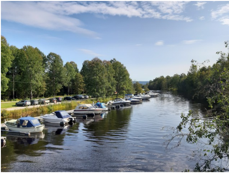
Utsikt sydover langs Vesleåa.