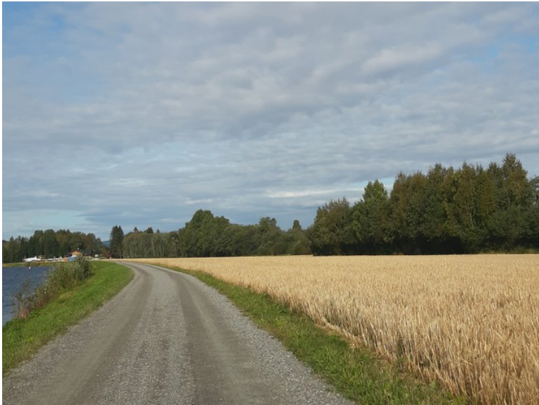
Kornet er ikke høstet ennå.