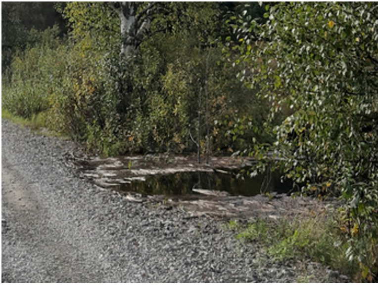
Veien mellom Engen og Øyen går på en fylling i Nora. Det er liten klaring ned til vannet.